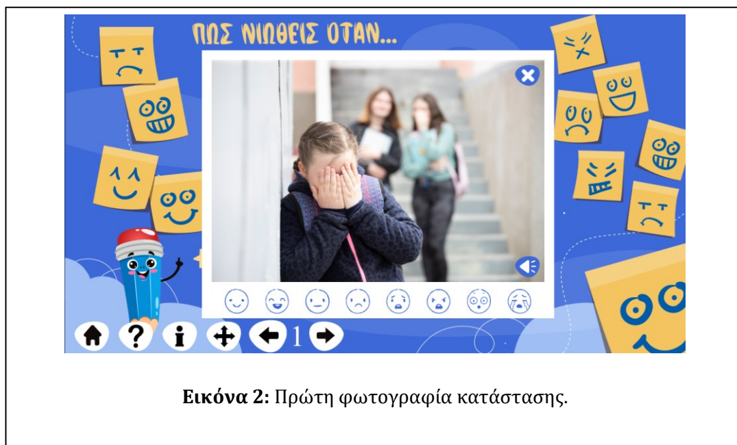
Εικόνα 2: Πρώτη φωτογραφία κατάστασης.

Μόλις πατήσουν το κουτί την πρώτη φορά, θα βγει η πρώτη φωτογραφία μιας κατάστασης που είναι ένα κοριτσάκι που έχει τα 2 της χέρια πάνω στο πρόσωπό της και 2 άλλα κορίτσια πίσω της να ψιθυρίζουν/γελάνε (Εικόνα 2). Η δραστηριότητα αυτή έχει 12 αληθινές φωτογραφίες με καθημερινά περιστατικά – συχνές καταστάσεις από τη ζωή των παιδιών. Στο κάτω μέρος της οθόνης υπάρχουν και οι αριθμοί για την κάθε φωτογραφία (ανάμεσα στα δύο βελάκια).