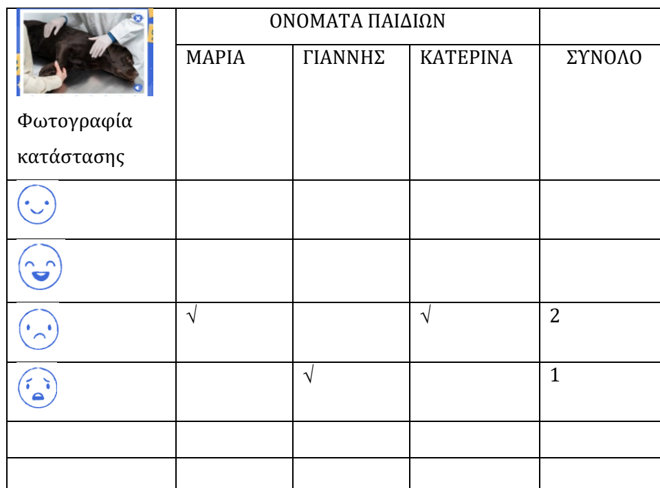
ΠΙΝΑΚΑΣ 1: Παράδειγμα για την καταγραφή των συναισθημάτων του κάθε παιδιού

οριζόντιες γραμμές θα βάλουν τα ονόματα των παιδιών (ή φωτογραφίες των παιδιών ή ένα σύμβολο) και στην κάθετη στήλη τα 8 συναισθήματα. Δίπλα σε κάθε συναισθήμα μπορούν να καταγράψουν ποια παιδιά το έχουν επιλέξει και το σύνολο των παιδιών στο τέλος. Ο πίνακας αυτός θα είναι πολύ χρήσιμος τόσο για τον/την νηπιαγωγό να αξιολογήσει τις γνώσεις και την κατανόηση των παιδιών αλλά και για να δοθεί η απαραίτητη προσοχή σε τυχόν δυσκολίες. Τα δεδομένα που θα συλλέξουν τα παιδιά θα μπορούν να οδηγήσουν σε περαιτέρω δραστηριότητες/διερευνήσεις κλπ.